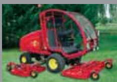
TURBO 6 - 6 FLAIL 60 HP