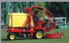
TURBO 1-1W-2-4 28-36 HP