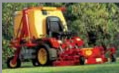
TURBOGRASS 20-22 HP