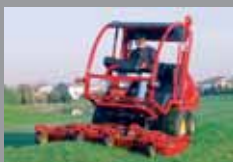
TURBO 5 50 HP