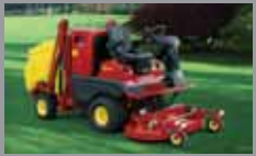
GT-RANGE 22-30 HP