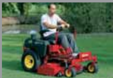
SRZ-RANGE 15-27 HP